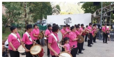
La Fanfare de l'Echo de la Vaire

Un grand bravo à l'équipe du comité des fêtes pour l'organisation de la « fête à Sausses 2022 », retour en image sur quelques moments marquants :