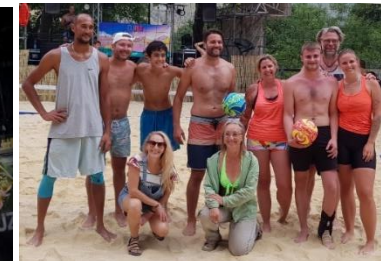
Victoire de l'équipe du Château pour le tournoi de Beach Volley