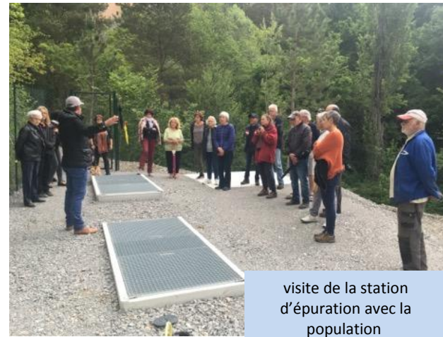
visite de la station d'épuration avec la population

Je profite de cet édito pour remercier également les volontaires qui ont participé à la matinée citoyenne de plantations et nettoyage du village qui s'est déroulée en juin et pour s'être déplacé en nombre lors de la visite de la station d'épuration.